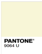
Rejected (Too Light)