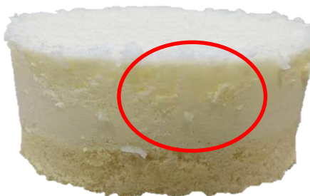
พบรอยเปื้อนของสปองจ์วานิลลาบนชั้นมูสมะพร้าว