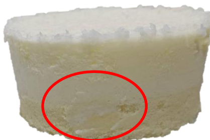
พบมูสมะพร้าวบนฐานชั้นสปองจ์วานิลลา