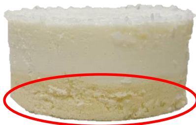
สปองจิวานิตลามิรอยแยก / รอยแตก