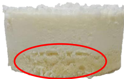
พบรอยแตก / รอยแยก ของชั้นฐานเค้กวานิลลากับชั้นมูสมะพร้าว