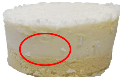
พบเกลือมะพร้าวในชั้นสปองจิวานิตลาหรือชั้นมูสมะพร้าว