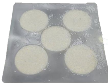
พบรอยเปื้อนของเจลใส มูส หรือเกลือคมะพร้าวที่ถาดมูสเค้ก