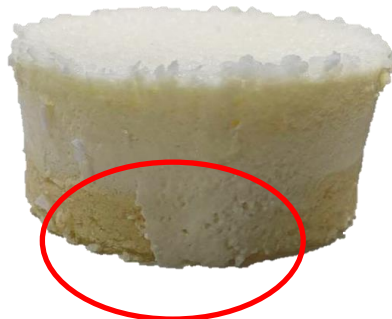
มูสไหลถึงฐานเค้ก