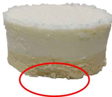
ฐานสปองจ๊วานิลลาแหงขนาดมากกว่า 1 ซม.