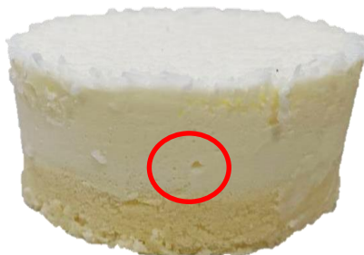
ขนาดเล็ก ไม่เกิน 1 ซม. (เช่น ฟองอากาศ และอื่น ๆ)