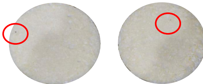
บนผิวหน้าของสินค้าพบเกลือสีดำจากกะหลามะพร้าว