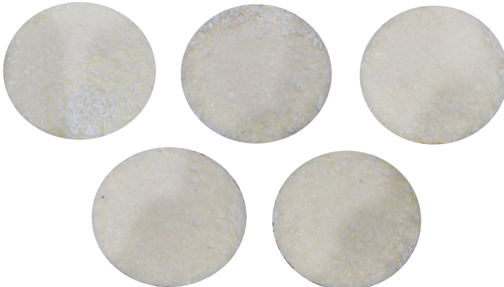
ผิวหน้าของสินค้าไม่เรียบหรือเป็นคลื่นจากเกลือคมะพร้าวและมูส